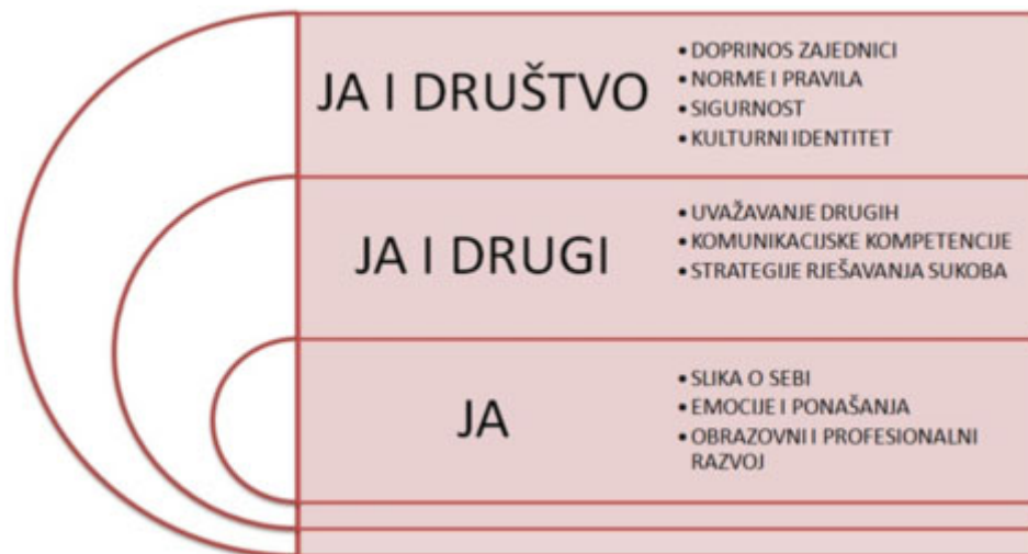
2. slika: Grafički prikaz domena u međupredmetnoj temi Osobni i socijalni razvoj